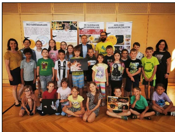
Die Fledermausausstellung in der VS Unterrabnitz

Nach einer 4jährigen Pause ist es endlich wieder soweit und die Wanderausstellung „Fledermäuse brauchen Freunde“ besucht Schulen im ganzen Burgenland. Dabei wird den Schülerinnen und Schülern das Wundertier Fledermaus, das oft sogar in der Heimatgemeinde seine Jungen aufzieht, auf vielfältige Weise nähergebracht. Bis jetzt erweckten die nächtlichen Jäger großes Interesse und führten zu spannenden Unterrichtsstunden.