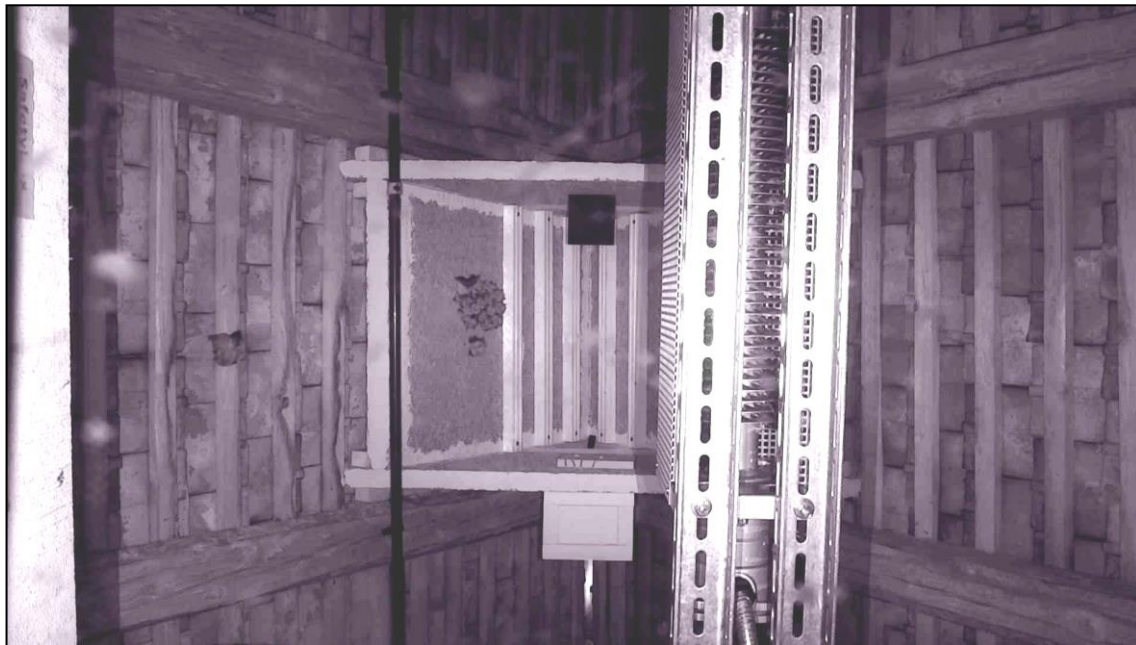
Blick in die beheizte Wärmeglocke am 3. Juni 2021 (Bild 4)

Da die Corona Pandemie jegliche Arbeiten am Dachboden des Schlosses Eggenberg, in dem sich die letzte österreichische Wochenstubenkolonie befindet (siehe BatNews Nr. 25 - März 2019), in der Periode 2019/2020 ausschloss, wurde erst am 5. November 2020 eine Beheizung in einer der 2019 angebrachten Wärmeglocken eingebaut und rechtzeitig vor Ankunft der trächtigen Weibchen am 2. März 2021 in Betrieb genommen.