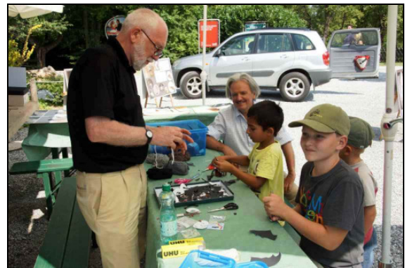
Jung und Alt beim Fledermaus Basteln