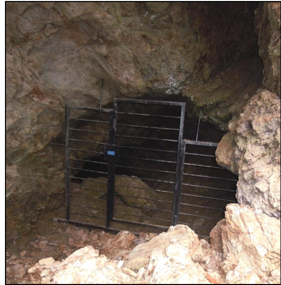
Abgesperrte Arztgrube bei Lockenhaus

Sie sind daher ein optimaler Zufluchtsort für Fledermäuse bei Schlechtwetter.