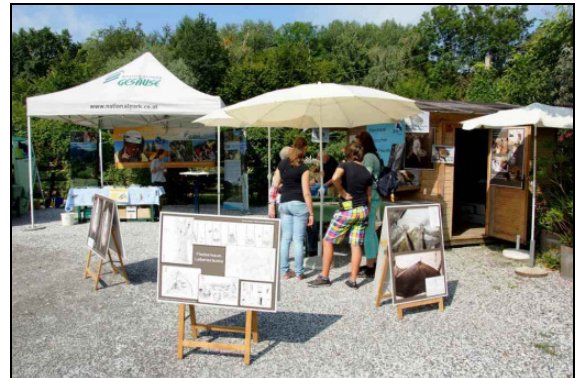
Der Stand von BatLife Österreich

Wie bereits 2010 nahm BatLife Österreich am 4. August d. J. an den Veranstaltungen der Zoschule Herberstein/Steiermark anlässlich des Artenschutztags teil.