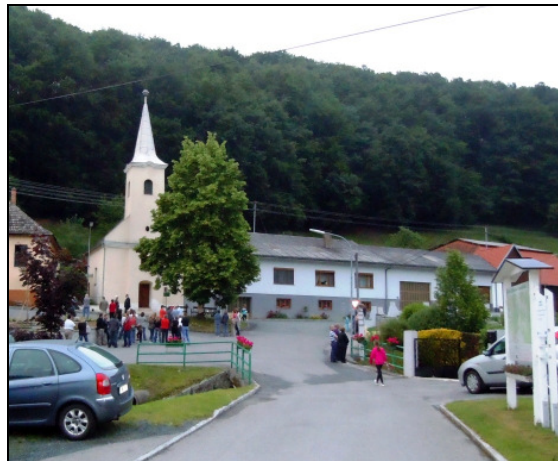
Gespanntes Warten auf den Ausflug vor der Kirche von Glashütten

Am 31. Mai 2012 veranstalteten die Gemeinde Glashütten bei Schlaining und BatLife Österreich eine Batnight. Die Veranstaltung war außergewöhnlich gut besucht. Nach einer Information über das Leben der Fledermäuse im gemütlichen Wirtshaus warteten Groß und Klein auf den Ausflug der Kleinen Hufeisennasen aus ihrer Wochenstube im Dachboden der Kirche.