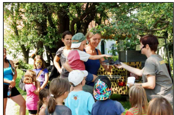
Die Preisverleihung: Mutter und Kind gewinnen eine Wollfledermaus