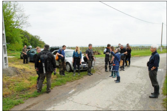
Einteilung der Suchteams

Eine Technologie, die bereits seit vielen Jahren zur Erforschung der Jagdgebiete und Aufenthaltsorte eingesetzt wird, ist die Telemetrie, bei der einzelne Fledermäuse mit einem Sender ausgestattet werden. Die Ausrüstung besteht aus einem am Rücken der Fledermaus angebrachten Sender, der nicht schwerer als 5% des Körpergewichts des Tiers sein darf, und Antennen, mit denen die vom Sender ausgesandten Frequenzen empfangen werden. Die Technik wird zum Auffinden eines Quartiers, in dem sich die besenderte Fledermaus aufhält, und zur Verfolgung der vom Quartier in die Jagdgebiete benutzten Wege angewandt. Daraus kann man schließen, in welchen Lebensräumen die