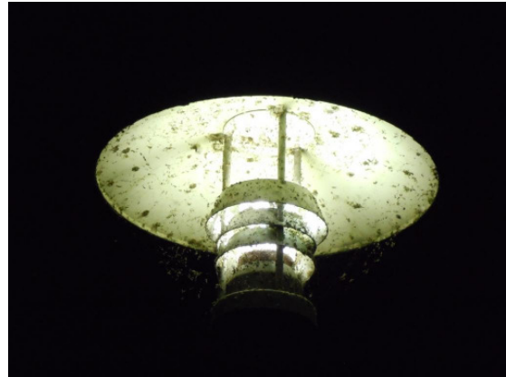
Strassenbeleuchtung mit unzähligen verschmorten Insekten

Allerdings wäre es völlig falsch zu meinen, dass Licht für einige Fledermäuse schädliche, für andere jedoch positive Auswirkungen hat. Jede Nacht kommen an den Straßenlampen, deren Licht Insekten unwiderstehlich anzieht, Millionen von Insekten um.