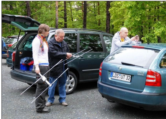
Abfahrt zur nächtlichen Suche

In der Zeit vom 4.-10. Mai 2013 verfolgten wir fünf besenderte Weibchen, in der Hoffnung, dass sie uns eine alternative Wochenstube führen würden.