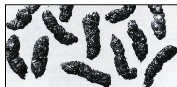
Kotpillen des Großen Mausohrs: Originallänge ca. 10 mm

Die Nahrung des Großen Mausohrs besteht vorwiegend aus Lauf- und Mistkäfern. Durchschnittlich 13 % des Gewichts eines Käfers werden als Kot abgesondert. Da das durchschnittliche Käfergewicht ca. 1 g beträgt, kann man darauf schließen, dass der entfernte Kot einer Gesamtzahl von etwa 10 Millionen gefressener Käfer entspricht.