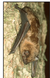
Fundort der Wochenstube des Abendseglers am Truppenübungsplatz